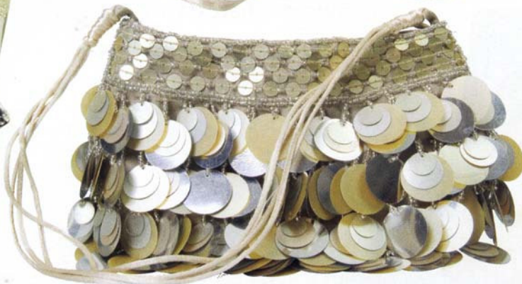
Veske med store paljetter i sølv og bronse 199. Accessorize. Tekopp med skål kr 199. Lene Bjerre.