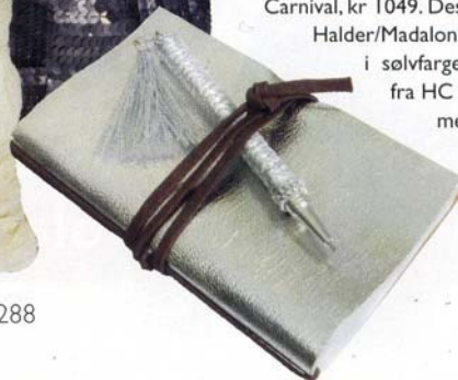
pute med dekor i oksidert messing, Carnival, kr 1049. Designet av Sunanda Halder/Madalon Home. Notatblokk i sølvfarget skinn kr 198 fra HC Shop og kulepenn med sølvdekor, kr 19, Indiska.