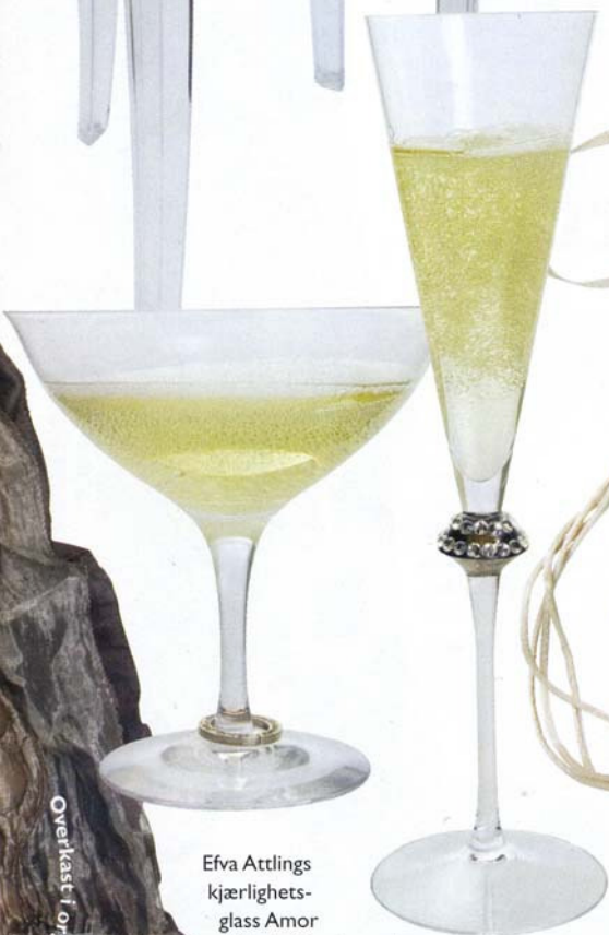
Efva Attlings kjerlighets- glass Amor