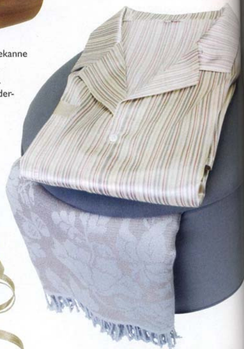
Perlemorskapper ca 3 kr per stk. Midhas. Silkebånd kr 1 per meter. Midhas. Silkepysj med striper i pastell kr 1250. Olivier Desforges/ Bellas Hus. Grå puff med oppbevaringsplass kr 399. Granit. Pledd i silke kr 2335 fra Yves Delorme/Bellas Hus.